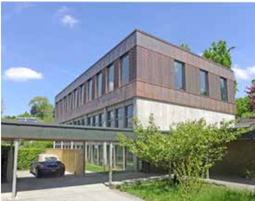
Schulen und Auditorien (Schule Kirchmatt, Zug)