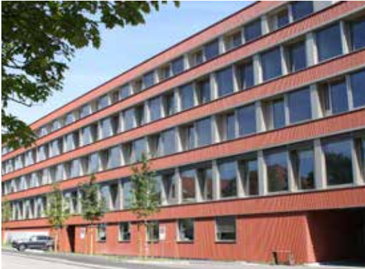
Spitäler, Alters- und Pflegeheime (Seniorenzentrum, Zofingen)

Bodenbeläge Aktiengesellschaft Société Anonyme