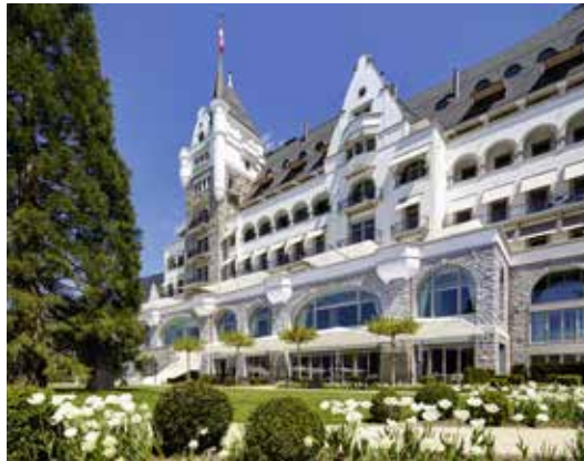
Hotels und Gastronomie (Parkhotel, Vitznau)