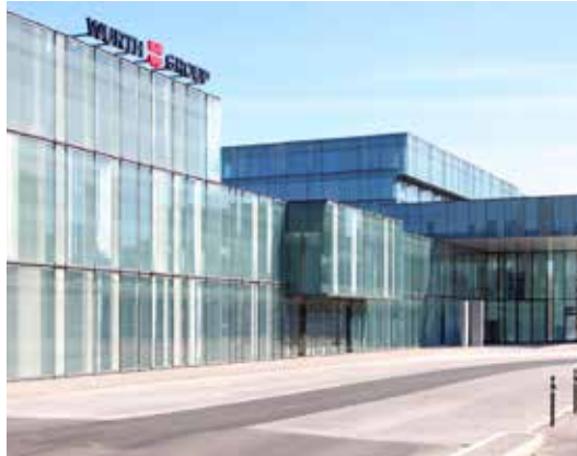
Bürogebäude (Würth Group, Rorschach)