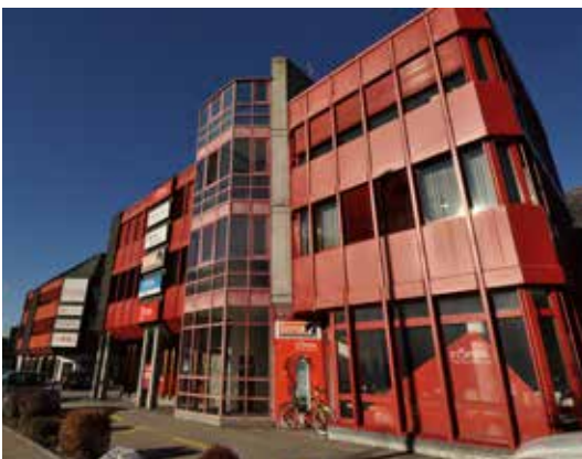
Verkauf und Ausstellungen (Ringstrasse, Chur)