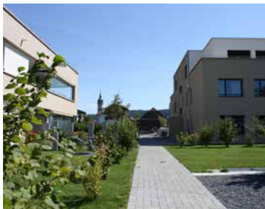
Wohnüberbauungen (Überbauung, Dagmersellen)